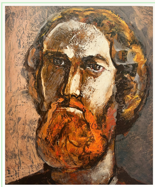
Autoportret - Constantin Tofan